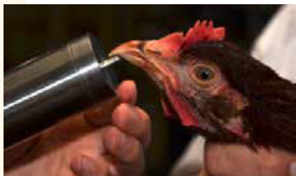
Figura 1. Medición automática de la longitud del pico

La idea subyacente es la siguiente: si en un futuro no se realiza ningún tratamiento de picos, las aves con picos romos infringirán menos daño a sus congéneres si las pican. Con ayuda de ese equipo, se mide la diferencia de longitud entre la parte superior e inferior del pico (lo que en adelante llamaremos la «longitud del pico» por simplicidad) y el resultado se guarda automáticamente en una base de datos ( Figura 1 ).